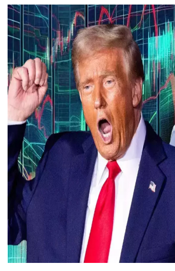
(સંપૂર્ણ સમાચાર સેવા) વોશિંગ્ટન, તા.૧૨ અમેરિકાના પ્રમુખ ડોનાલ્ડ ટ્રમ્પે પેલેસ્ટાઈનના ઉશ્વેચક સંગઠન હમાસને આકરી ધમકી આપી છે. ડોનાલ્ડ ટ્રમ્પે કહ્યું કે, જો શનિવાર સુધી હમાસ ઈઝરાયેલના અપહરણ કરાયેલા નાગરિકોને છોડશે નહીં તો ગાઝામાં બધું બરબાદ થઈ જશે. આ સાથે, ટ્રમ્પે કહ્યું કે જો શનિવારે ૧૨ કલાક સુધી તમામ બંધકોને છોડાશે નહીં તો મને લાગે છે કે સીડકાઈયરની સમજૂતિનો કારાર

૨૬ કરી દેવો જોઈએ. જોકે, ટ્રમ્પે ઓવલ ઓફિસમાં મીડિયા સમક્ષ કહ્યું કે, સીડકાઈયર ચાલુ રાખવો કે બંધ કરવો એ નિર્ણય ઈઝરાયેલે લેવાનો છે. પરંતુ બાકીના તમામ બંધકોને એક સાથે જ મુક્ત કરવા જોઈએ, નહીં કે ત્રણ-ચાર જૂથમાં. અમે તમામ બંધકોને એક સાથે મુક્ત કરવામાં આવે તેમ ઈચ્છીએ છીએ. જોકે હું આ વાત ફક્ત મારા તરફથી કહી રહ્યો છું. ટ્રમ્પનું કહેવું છે કે એ શનિવાર સુધીની સમયમર્યાદાને લઈને એ ઈઝરાયેલના વડાપ્રધાન બેન્જામિન નેતન્યાહુ સાથે વાતચીત કરશે. જોકે, આ અંગે વધુ માહિતી આપી નથી. હમાસે મુદ્દે સમજૂતી કરે કે હું શું કહેવા ઈચ્છું છું. આ પહેલા ટ્રમ્પે ગાઝા પર કબજો કરીને ત્યાં સિટી રિસોર્ટ બનાવવાની વાત કહી છે. ત્યારે ટ્રમ્પે કહ્યું હતું કે પેલેસ્ટાઈનના લોકોને ગાઝામાંથી વિસ્થાપિત કરીને જોર્ડન અને ઈજીપ્તમાં વસાવવા જોઈએ. જોકે, જોર્ડન અને ઈજીપ્ત બંને ટ્રમ્પના આ પ્લાનનો વિરોધ કર્યો હતો.