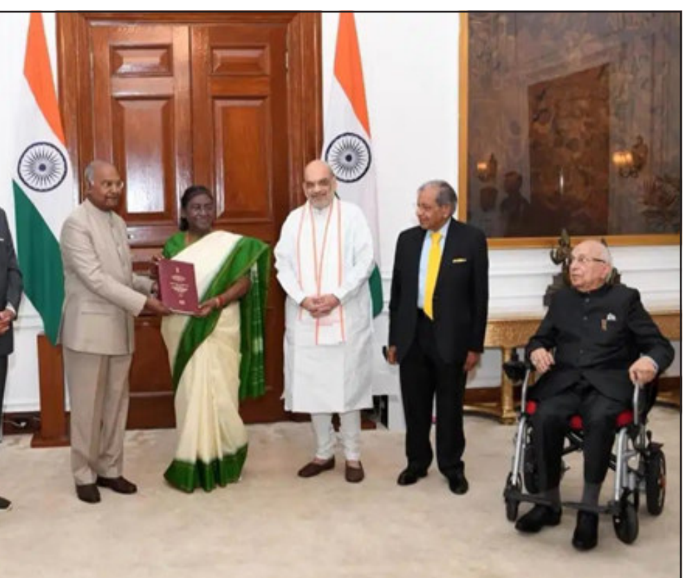
વિધાનસભાની ચૂંટણી એક સાથે થવી જોઈએ. આ પછી, બીજા તબક્કામાં, સ્થાનિક સંસ્થાઓની ચૂંટણી ૧૦૦ દિવસમાં થઈ શકે છે. ત્રીજા તબક્કામાં સમિતિએ એવી પણ ભલામણ કરી છે કે ચૂંટણી પંચ આ ચૂંટણીઓ માટે માત્ર એક જ મતદાર આઈડી તૈયાર કરી શકે છે. ઉપરાંત સુરક્ષા દળો, વહીવટી અધિકારીઓ અને કર્મચારીઓની વ્યવસ્થા માટે અગાઉથી આયોજન કરવાની ભલામણ કરવામાં આવી છે.

સરકાર આ કાર્યકાળ દરમિયાન ‘એક દેશ એક ચૂંટણી’ લાગુ કરશે. આ પહેલા ભાજપે લોકસભા ચૂંટણી માટેના પોતાના ધોષણપત્રમાં ‘એક દેશ એક ચૂંટણી’ના વચનનો પણ સમાવેશ કર્યો હતો. વન નેશન-વન ચૂંટણીને લઈને પૂર્વ રાષ્ટ્રપતિ રામનાથ કોવિંદની અધ્યક્ષતામાં ૨ સપ્ટેમ્બર, ૨૦૨૩ના રોજ એક સમિતિની રચના કરવામાં આવી હતી. આ સમિતિએ આ વર્ષે ૧૪ માર્ચે રાષ્ટ્રપતિ દ્રૌપદી સુમુને પોતાનો રિપોર્ટ સોંપ્યો હતો. કમિટીએ ૧૯૧ દિવસ સુધી અનેક નિષ્ણાતો અને રાજકીય પક્ષોના લોકો સાથે ચર્ચા કર્યા બાદ ૧૮ જાન્યુઆરી ૨૦૨૪ના રિપોર્ટ સોંપ્યો હતો. જેમાં તમામ રાજ્યોની વિધાનસભાઓનો કાર્યકાળ ૨૦૨૮ સુધી લંબાવવાનું સૂચન કરવામાં આવ્યું હતું, જેથી આગામી લોકસભા ચૂંટણીની સાથે તેમની ચૂંટણી પણ યોજવામાં આવે. વન નેશન-વન ઈલેક્શનને લઈને રજૂ કરવામાં આવેલા આ રિપોર્ટમાં ત્રિશંકુ વિધાનસભા અને અવિશ્વાસ પ્રસ્તાવની સ્થિતિ અંગે પણ સૂચનો આપવામાં આવ્યા છે. સમિતિએ ભલામણ કરી છે કે આવી સ્થિતિમાં વિધાનસભાની બાકીની મુદત માટે ચૂંટણી યોજવામાં આવી શકે છે. આ રિપોર્ટમાં દેશભરમાં ત્રણ તબક્કામાં ચૂંટણી કરાવવાનું પણ સૂચન કરવામાં આવ્યું છે. સમિતિના મતે, પ્રથમ તબક્કામાં લોકસભા અને